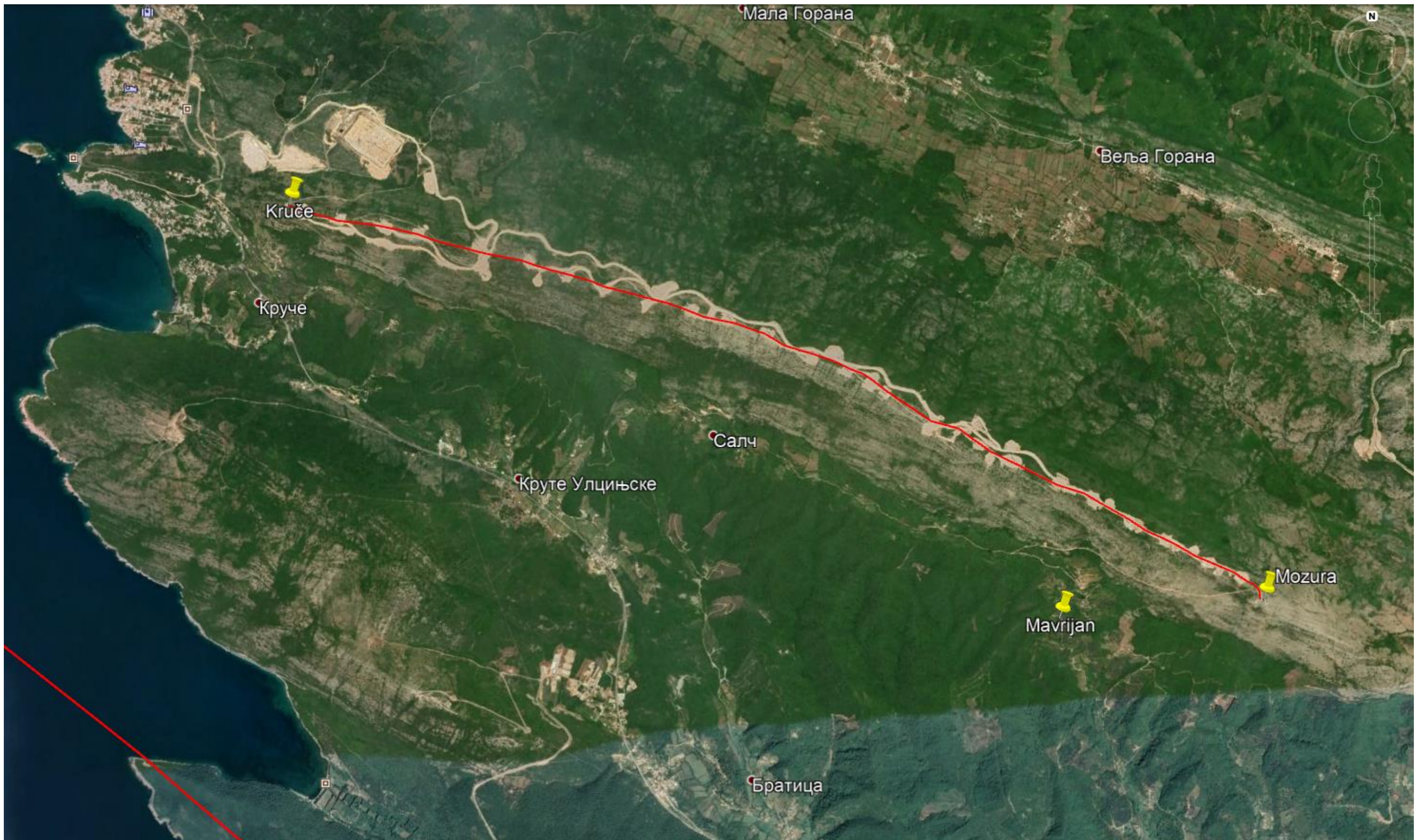
Slika 2. Trasa optičkog kabla u Ulcinju (povezuje RDC-ove telekomunikacione objekte Možura i Kruče)